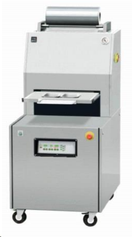
☞ ☞ Termosigillatrice manuale per vaschette Manual heat-sealing machine for trays